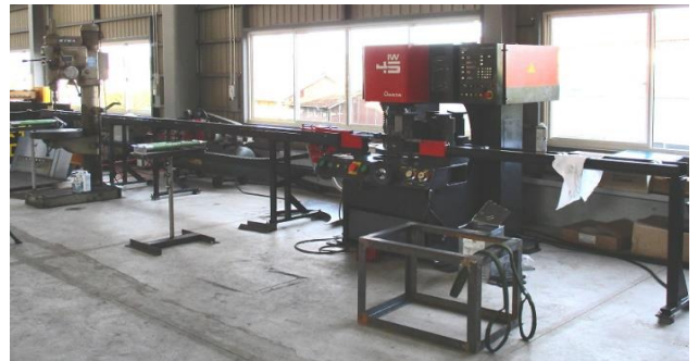
[ラジアルボール盤&アイアンワーカー]