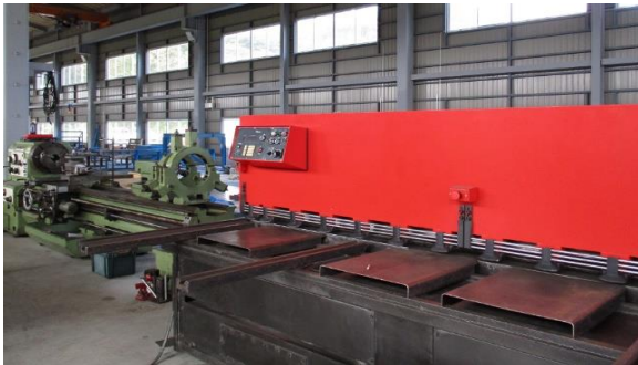
[3mWシャーリングマシン&長尺旋盤]