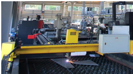
[自動エアープラズマ機]